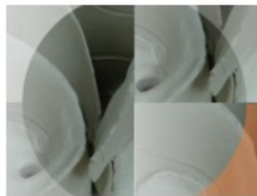
Reggio Werkstatt Lehrgang