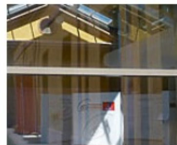
Reggio Studienreise Info