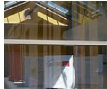
Reggio Studienreise Info