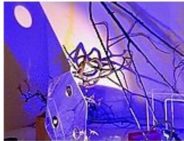
Reggio Atelier Professionallehrgang